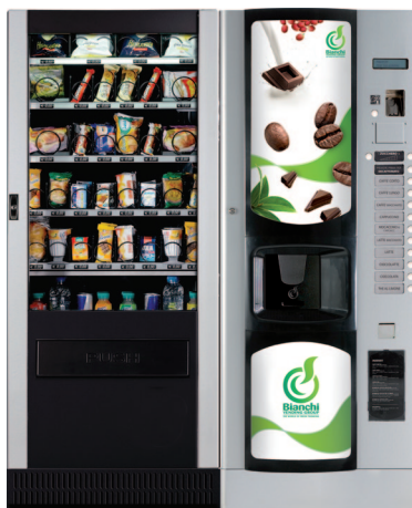
BVM 676 & LEI 400