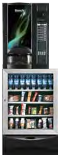
BVM 921 + VISTA S